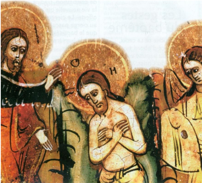
Les gestes du baptême

Lors de la célébration, il est demandé par trois fois au baptisé s'il rejette le mal et le péché, puis s'il adhère à la foi de l'Église telle qu'elle est résumée dans le je crois en Dieu (le Credo). S'il s'agit d'un petit enfant, ce sont les parents, parrain et marraine qui répondent à sa place. Un adulte affirmera lui-même sa foi. Tous s'engagent à vivre en baptisé, selon l'esprit de l'Évangile.